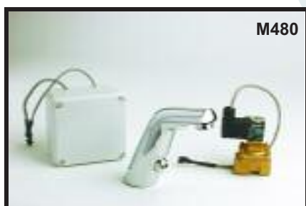
Grifo para lavabo infrarrojo