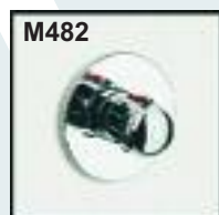
Válvula termostática empotrable en pared